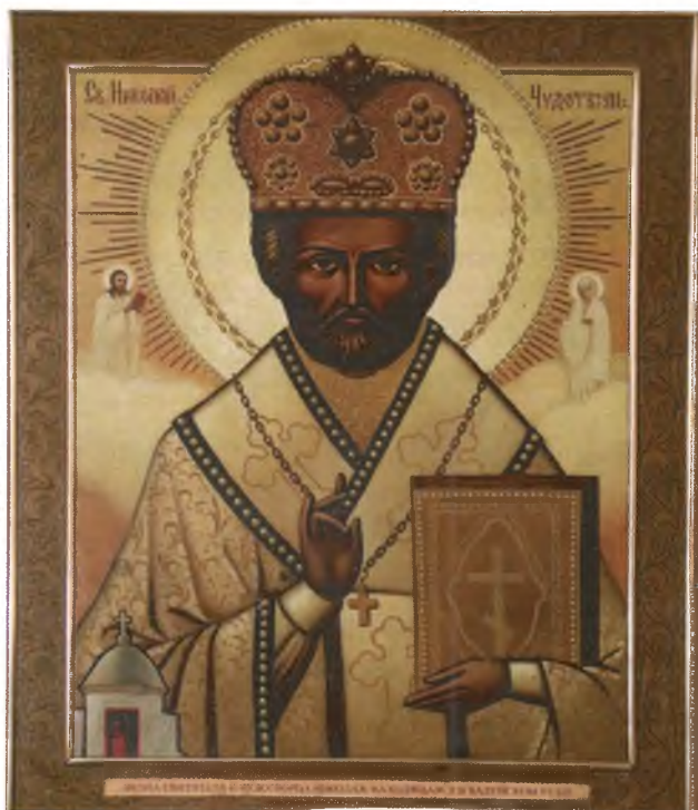
Икона Николая Чудотворца, хранившаяся в Успенском монастыре. Известны случаи исцеления людей с помощью этой чудотворной иконы