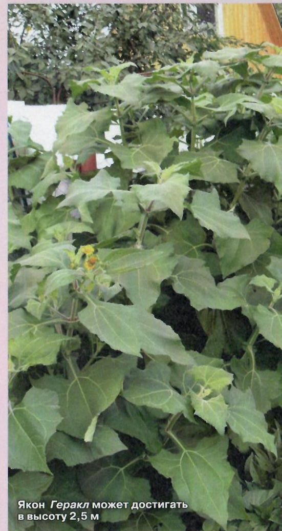
Якон Геракл может достигать в высоту 2,5 м

Растение высотой 1,5-2 м выглядит привлекательно и радует изумрудной зеленью до первого заморозка. Особен-