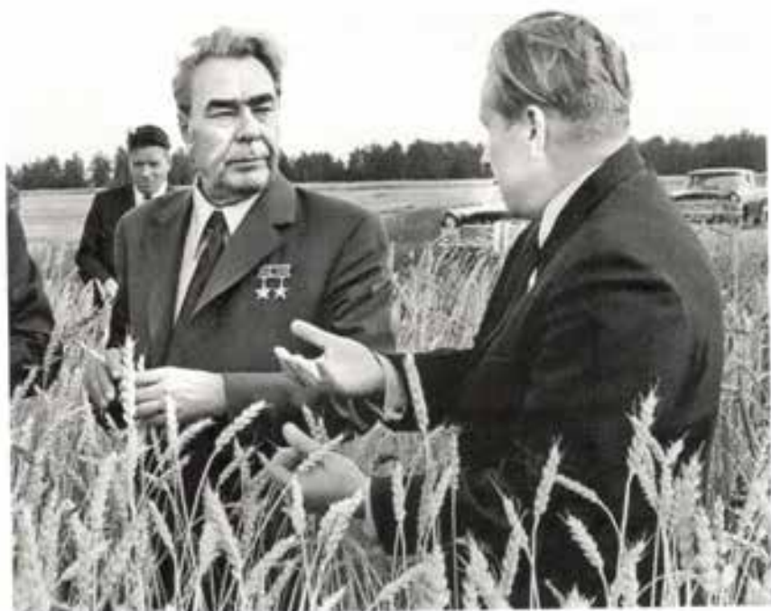
* 12 Генсек ЦК КПСС Леонид Брежнев в Алтайском НИИ сельского хозяйства, 1972 год.

составляла 90 рублей 10 копеек, то в 1982-м она выросла до 177 рублей 30 копеек 16 .