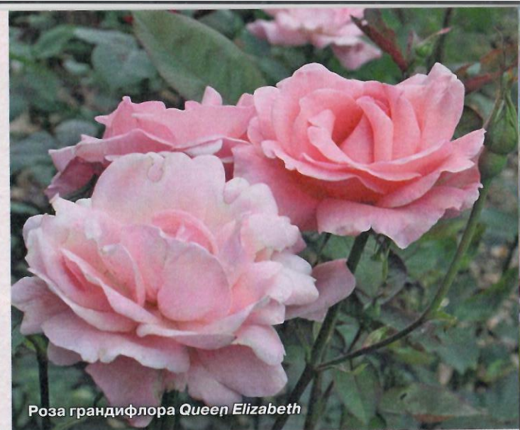
Роза грандифлора Queen Elizabeth

После снятия укрытия, но до того, как распустятся почки, проведите весеннюю обрезку роз (в