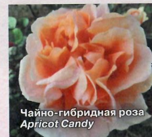
Чайно-гибридная роза Apricot Candy