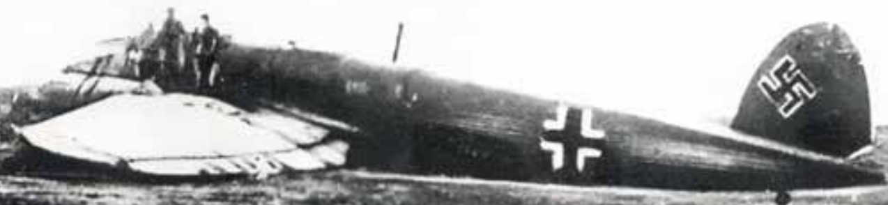
*3 Немецкий бомбардировщик, угнанный Девятаевым, на месте вынужденной посадки. 8 февраля 1945 года.