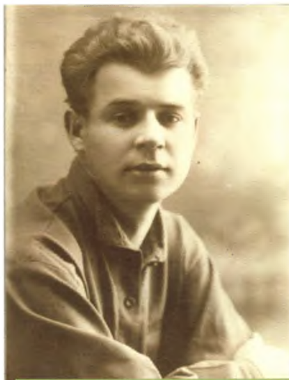
Сергей Есенин, 1924 год

Новый с поля придёт поэт, В новом лес огласится свисте. По-осеннему сыплет ветер, По-осеннему шепчут листья.