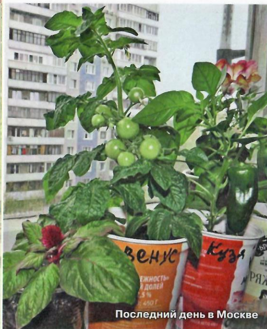
Последний день в Москве