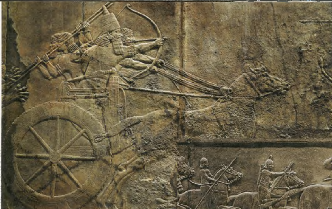
◀ «Ашшурба-напал охотится на львов». Рельефы из Северного дворца в Ниневии, 645–635 годы до н. э.