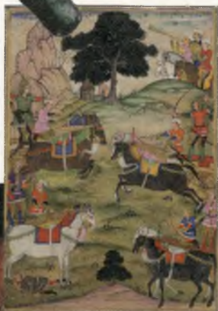
▲ Колесница на иллюстрации одной из сцен индийского эпоса.