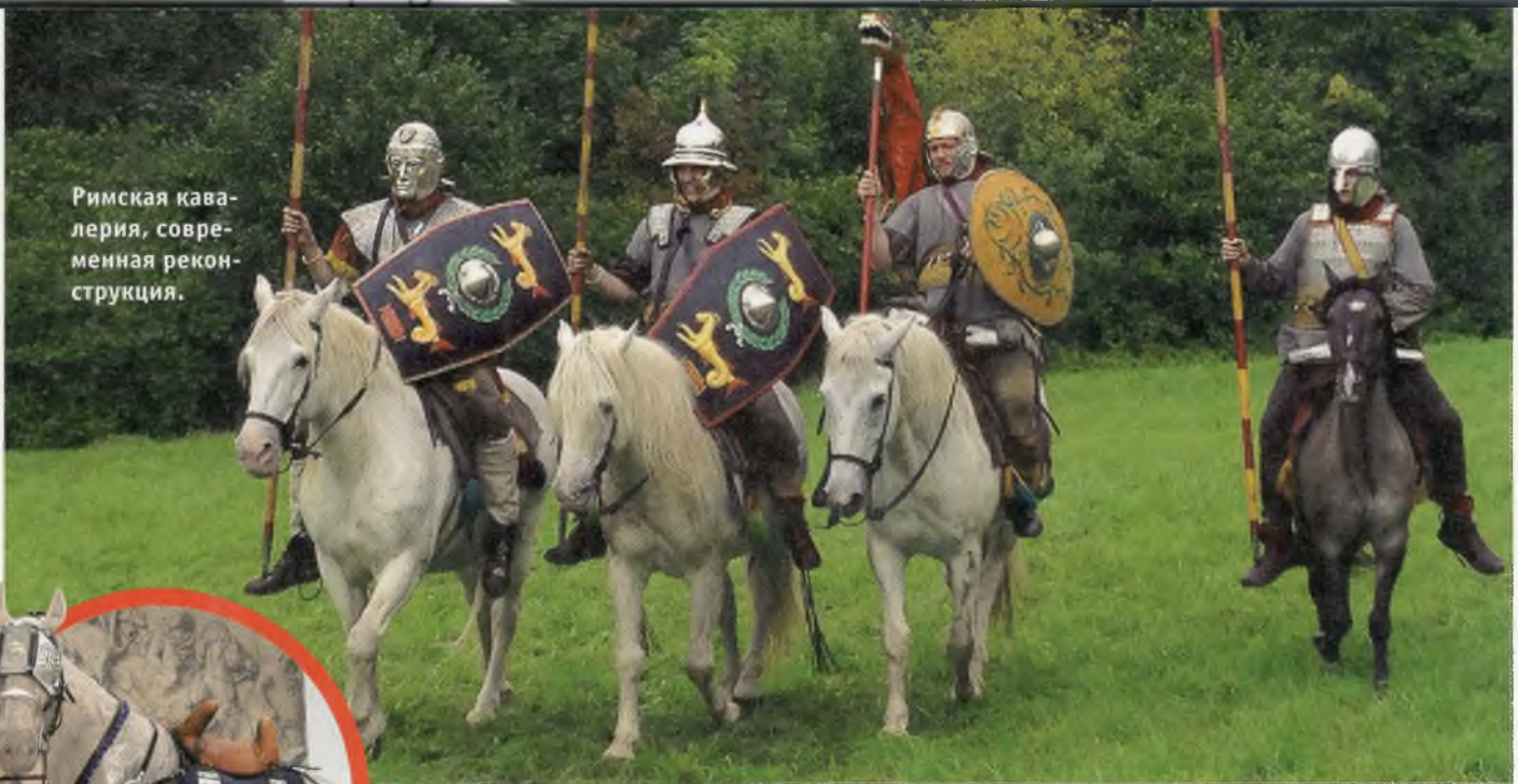
Римская кавалерия, современная реконструкция.