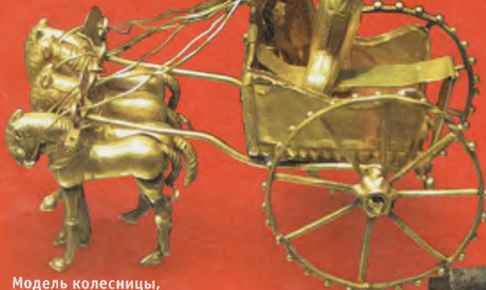
Модель колесницы, сделанная в VI-V веке до н. э. в Персии.

будущих киммерийцев, скифов и сарматов, создали колеса со спицами. Кочевникам удалось не только научить коней ходить в упряжке, но и вывести породу выносливых и сильных животных (дикие степные лошади вообще-то были малорослыми), способных мчать колесницу во весь опор.