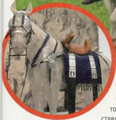
▲ Упряжь римского военного коня в Музее Валкгоф-Кам в Нидерландах.

пытались использовать и тяжелую пехоту из наемных греков.