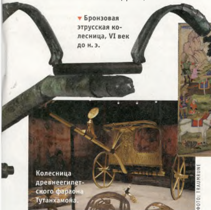
Колесница древнеегипетского фараона Тутанхамона.