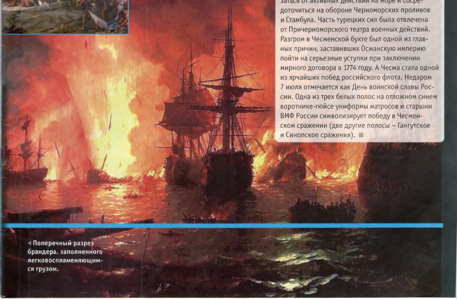
◀ Поперечный разрез брандера, заполненного легковоспламеняющимся грузом.