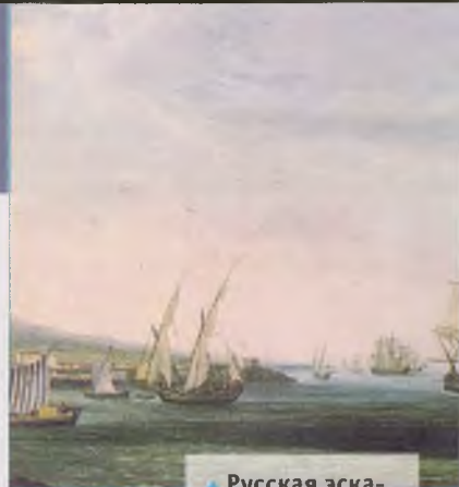
▲ Русская эскадра у берегов Катании (Италия), картина Якоба Хаккерта.

Русским было известно, что турецкий флот обладает значительным превосходством. Противник имел 16 линейных кораблей, шесть фрегатов, 19 парусно-гребных судов и 32 вспомогательных корабля с 15 тысячами человек на борту. Командовал флотом опытный флотоводец Хасан-бей по прозвищу Джезаирли (Алжирец). Правда, турецкие матросы уступали русским морякам в выучке. Как мы уже говорили, турки выстроили свои корабли в две дугообразные линии. В первой линии находилось 10 линейных кораблей, во второй – шесть линейных кораблей и шесть фрегатов. Вспомогательные суда стояли за второй линией. Правда, из-за тесного построения флота стрелять из пушек могли только суда первой линии. ➤➤