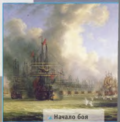
▲ Начало боя в Хиосском проливе, картина Якоба Хаккерта.