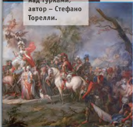
▼ Картина – аллегория на победу Екатерины II над турками, автор – Стефано Торелли.

Чесменское сражение оказало значительное влияние на дальнейший ход войны. Фактически лишившись флота, турки были вынуждены отказаться от активных действий на море и сосредоточиться на обороне Черноморских проливов и Стамбула. Часть турецких сил была отвлечена от Причерноморского театра военных действий. Разгром в Чесменской бухте был одной из главных причин, заставивших Османскую империю пойти на серьезные уступки при заключении мирного договора в 1774 году. А Чесма стала одной из ярчайших побед российского флота. Недаром 7 июля отмечается как День воинской славы России. Одна из трех белых полос на отложном синем воротнике-гойсе униформы матросов и старшин ВМФ России символизирует победу в Чесменском сражении (две другие полосы – Гангутское и Синопское сражения). ■