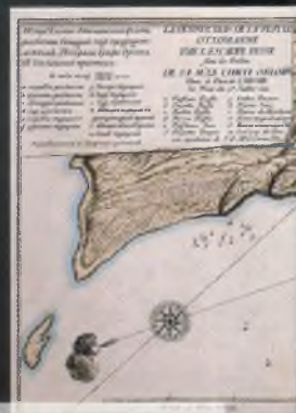
▲ План Чесменского сражения.

На военном совете русской эскадры было принято решение не мешкая сжечь весь турецкий флот. Был создан специ-