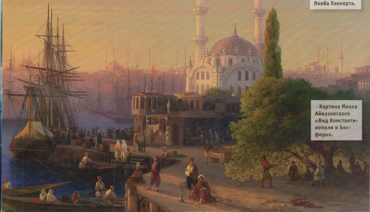
▲ Картина Ивана Айвазовского «Вид Константинополя и Босфора».