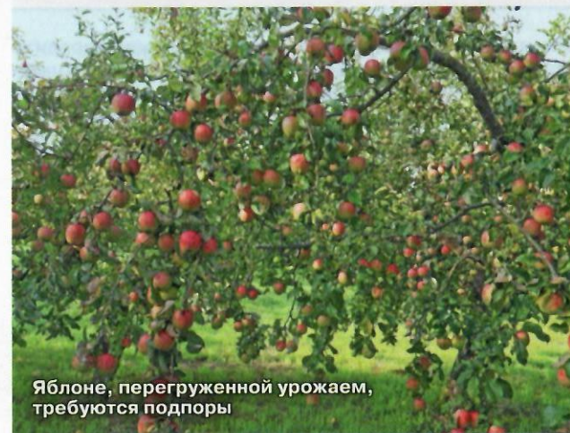
Яблоне, перегруженной урожаем, требуются подпоры

д) подвой несовместим с привоем - снова возникает дисбаланс питания и появляется поросль; обычно в этом случае привой в месте прививки заметно утолщается, дерево слабо растет и раньше срока окрашивает листья в осенние цвета и