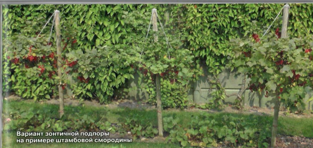
Вариант зонтичной подпоры на примере штамбовой смородины

б) проверьте, не забыли ли вы снять этикетку - бывает, садовод сажает молодое деревце вместе с ней, и со временем обвязка начинает перетягивать ствол у основания, врезается в ко-