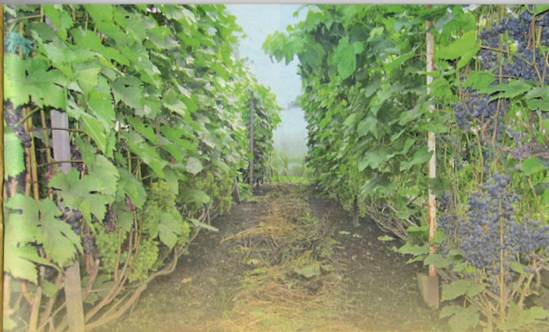
Порядок на винограднике - одна из составляющих успеха

сколько приемов. Самый простой и эффективный - весеннее и осеннее укрытие виноградных кустов от заморозков. Осеннее укрытие надо начинать в конце августа или после сбора урожая. Необходимо снять лозу со шпалеры, уложить в траншею и укрыть двумя слоями укрывного материала, перекинув через прово-