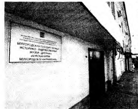
Почти год музей-диорама будет находиться здесь: улица Мичурина, 43