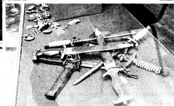
Важная часть экспозиции – холодное оружие