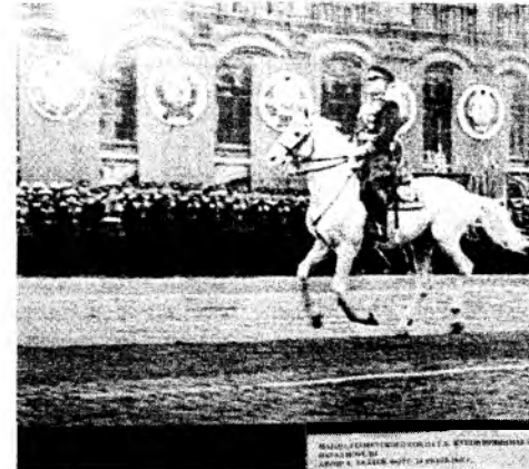
Одна из знаменитых фотографий Евгения Халдея – маршал Жуков, принимающий Парад Победы

Ожидается, что комплексный ремонт здания музея на улице Попова завершится к 9 Мая