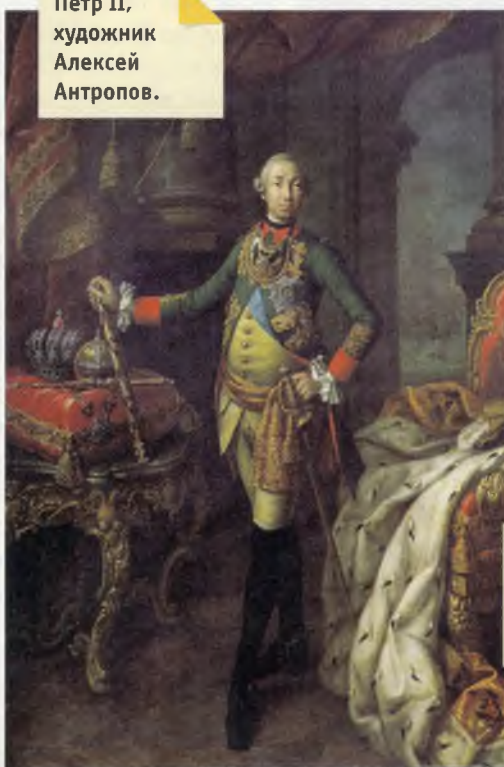
Петр II, художник Алексей Антропов.