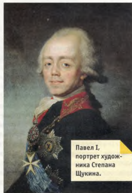
Павел I, портрет художника Степана Щукина.

ПЕТР АЛЕКСАНДРОВИЧ ВСЯЧЕСКИ НАСМЕХАЛСЯ НАД ПОТЕМКИНЫМ, СЧИТАЯ ДВОРЦОВЫМ ШАРКУНОМ И НЕ ПРИЗНАВАЯ ПРОФЕССИОНАЛЬНЫМ ВОЕННЫМ.