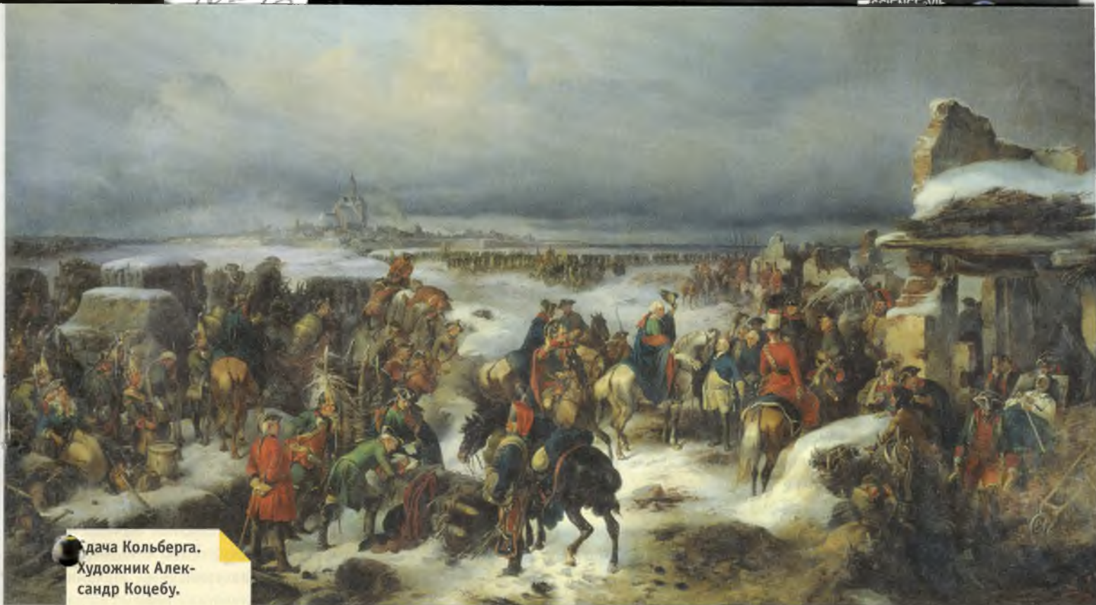
Осада Кольберга. Художник Александр Коцебу.

ненных. В 1743 году капитан Румянцев доставил в Петербург известие о заключении мира со Швецией, в подготовке которого главную роль сыграл его отец. За это императрица Елизавета произвела Румянцева-старшего в графы, а его сына – в полковники и командиры Воронежского пехотного полка. Елизавета всегда хорошо относилась к Александру Ивановичу, и ей понравился его сын – красавец огромного роста и недюжинной силы, лихой удалец, в совершенстве владеющий шпагой и попадающий из пистолета в подброшенную монету. Тогда же молодой граф женился на дочери петровского полководца Михаила Голицына – княжне Екатерине. Брак оказался неудачен (хотя в нем и родилось трое сыновей), а Петр продолжал вести разгульный образ жизни.