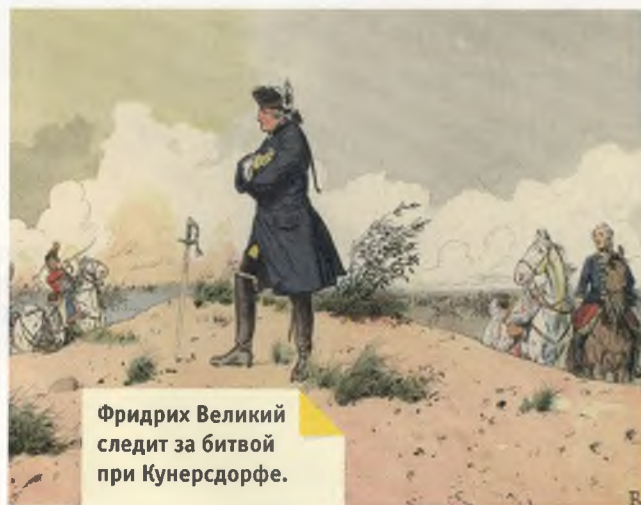
Фридрих Великий следит за битвой при Кунерсдорфе.

В Финляндии молодой офицер приобрел боевой опыт. Он отличался отчаянной храбростью и презрением к смерти, добился доверия солдат своей роты, не брезговал есть из солдатского котла, строго следил за снабжением подчи-