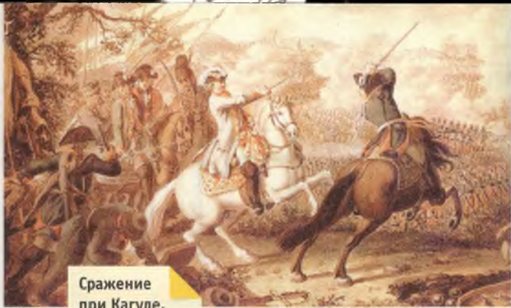
Сражение при Кагуле.