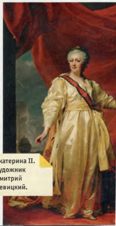
Екатерина II. Художник Дмитрий Левицкий.