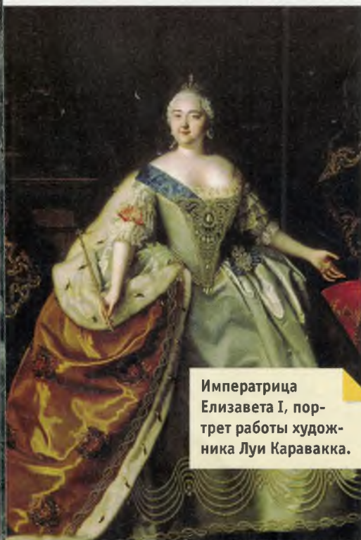
Императрица Елизавета I, портрет работы художника Луи Каравакка.