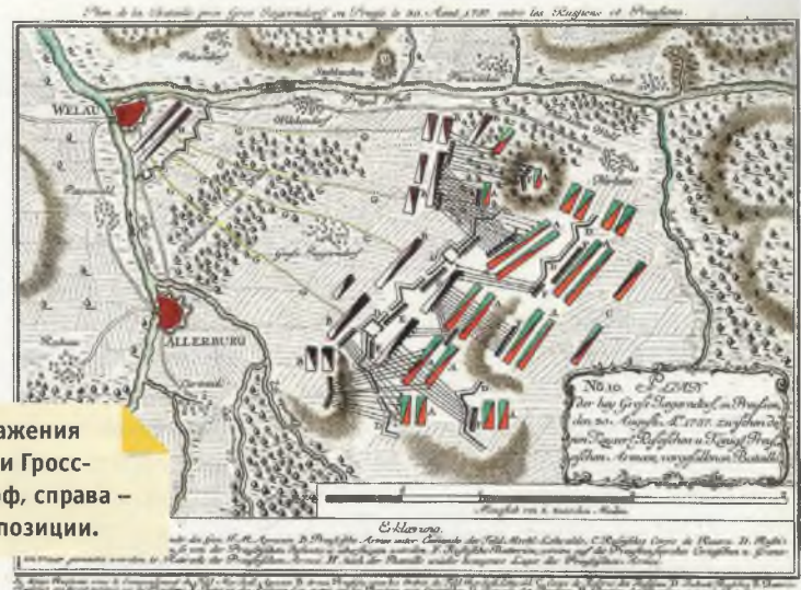
Карта сражения у деревни Гросс-Егерсдорф, справа – русские позиции.

Имя Петра Румян-цева гораздо менее известно, чем имена Суворова или Кутузова. И совершенно напрасно!