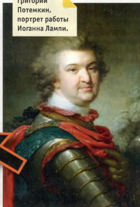
Григорий Потемкин, портрет работы Иоганна Лампи.

ПЕТР АЛЕКСАНДРОВИЧ ВСЯЧЕСКИ НАСМЕХАЛСЯ НАД ПОТЕМКИНЫМ, СЧИТАЯ ДВОРЦОВЫМ ШАРКУНОМ И НЕ ПРИЗНАВАЯ ПРОФЕССИОНАЛЬНЫМ ВОЕННЫМ.