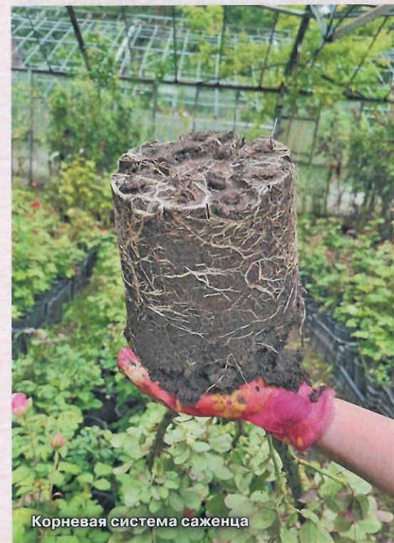
Корневая система саженца