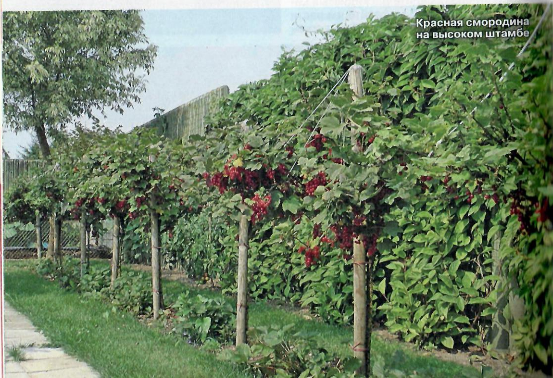
Красная смородина на высоком штамбе

В холодных районах проблему подмерзания «ягодных деревьев» можно преодолеть двумя способами. Первый: ежегодно пригибать растения на зиму, но это связано с огромной дополнительной работой. Особенно много проблем подстерегает «деревца» в местностях с сильными морозами (север страны, Урал, Сибирь). В этих регионах стоит обратить внимание на второй способ: применить модификации «деревьев» с очень коротким штамбом высотой 25-35 см. Увы, «коротконогие деревца» теряют толику очарования штамбовых растений: они выглядят куда менее эффектно, проводить обрезку и сбор плодов придется опять-таки согнувшись в три погибели, а полоть сорняки под кроной будет не намного легче, чем под кустами. При этом для создания как высокого, так и низкого «деревца» нужен дорогой и малодоступный саженец, к тому же он пожизненно будет нуждаться в тщательной ежегодной обрезке.