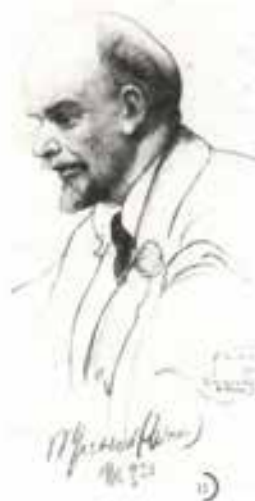
*11 И. Бродский. Ленин. 1920 год.