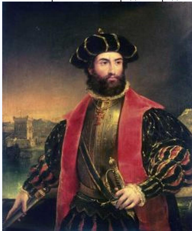
Васка да Гама продолжил дело отца-путешественника.

Умер Колумб в болезни и нищете и даже после смерти не нашел покоя. Его останки переносили из города в город несколько раз.