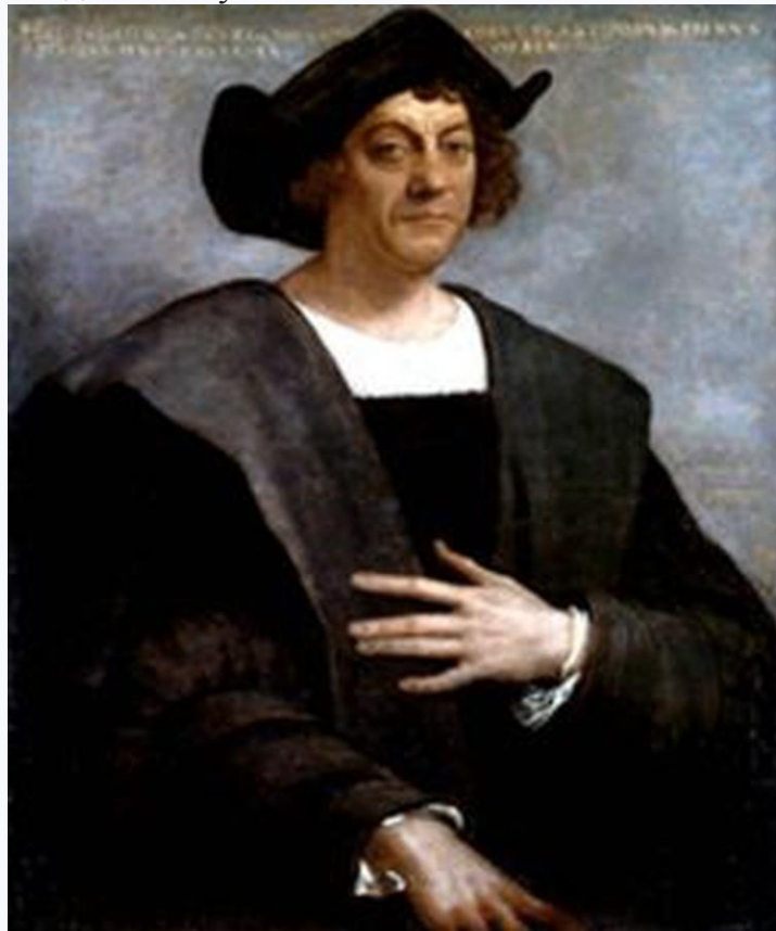
Как говорят современники путешественника - Колумба сгубила жадность. Христофор Колумб (1451 – 1506)

Ученый скончался в родном для него Петербурге на больничной койке, многочисленные экспедиции к 42 годам полностью «износили» организм. Коллекции и бумаги Миклухо-Маклая - шестнадцать записных книжек, шесть толстых тетрадей, планы, карты, собственные рисунки, газетные вырезки, журнальные статьи, дневники разных лет - были переданы Императорскому Русскому Географическому Обществу и помещены в музей Императорской Академии Наук.