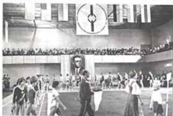
Операция на Дворце спорта «Спартак» международных соревнований по волейболу, Белгород, 1973 г.