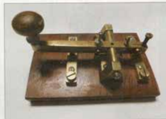
Радиотелеграфный ключ с броненосца «Орёл»