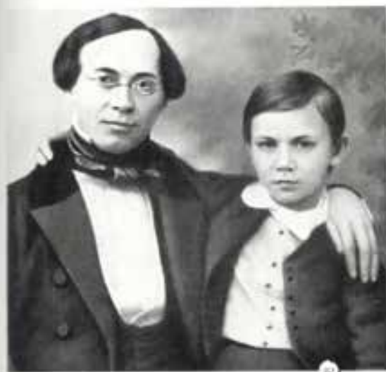
*1 Анатолий Федорович Кони.