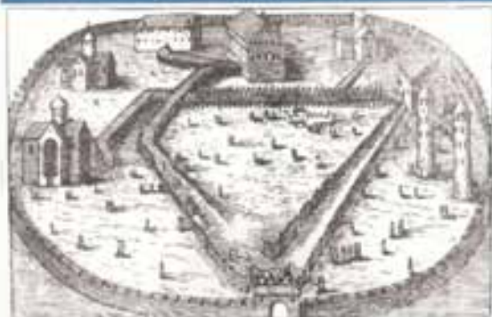
Александровская слобода XVI века – опричная столица. Гравюра И. Т. де Бри

Реконструкция трона Ивана Грозного в музейной экспозиции