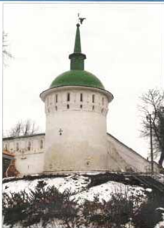
Одна из башен Александровского кремля

В декабре 1564 года в истории Московии произошло событие, о причинах которого историки спорят уже много веков. Загородная резиденция-крепость — Александровская слобода стала опорной столицей государства. В стране начались реформы, которые, по мнению Ивана IV Васильевича, должны были окончательно