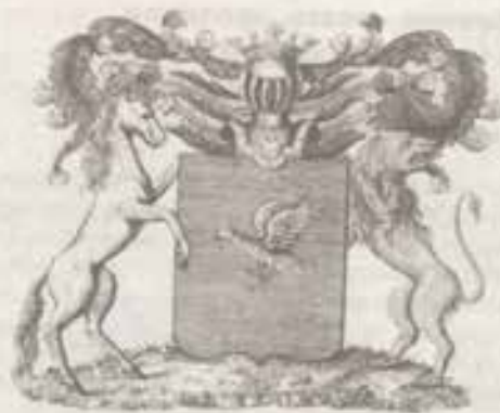
Герб дворянского рода Бибииковых.

В марте этого года Петр I отправил его в Стокгольм. Чиновнику был дан целый ряд важных поручений - пригласить для работы в России служащих Камер-коллегии, артиллерийских офицеров, инженеров, рудокопов, шпандного мастера для флота, а также достать рецепт состава, предо-