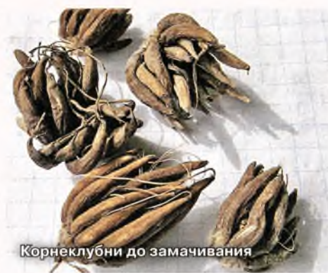
Корнеклубни до замачивания