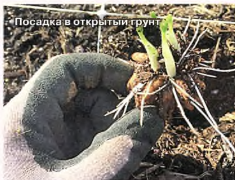
Посадка в открытый грунт