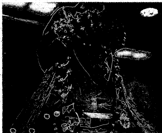
Типичный костюм и украшения представительниц женской древнерусской аристократии