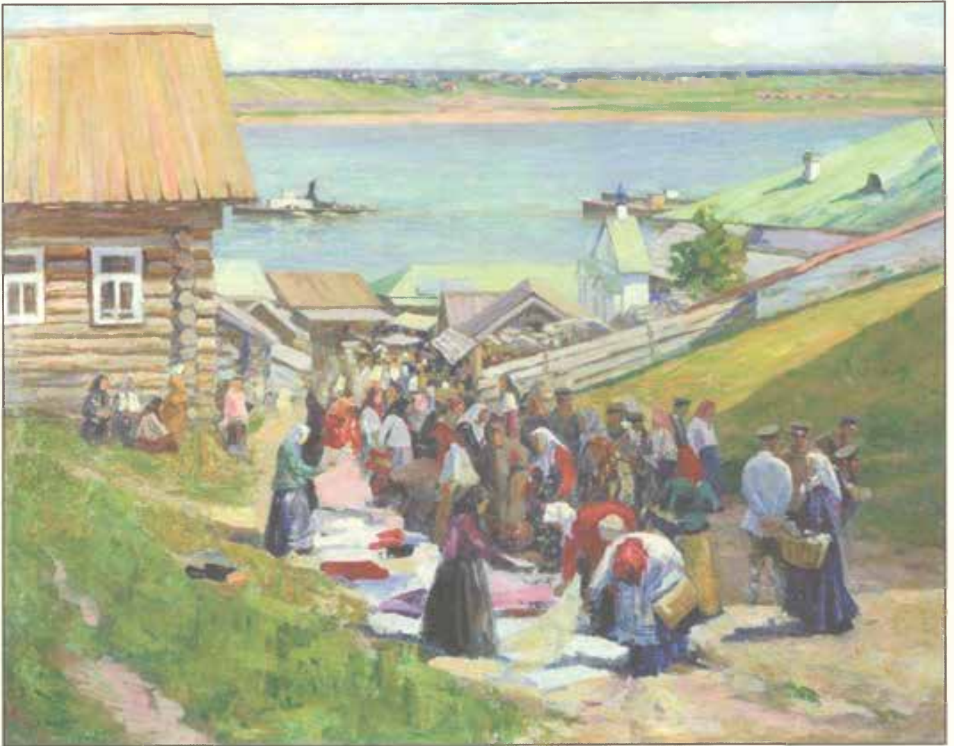
Торговля лоскутом. 1908 г.