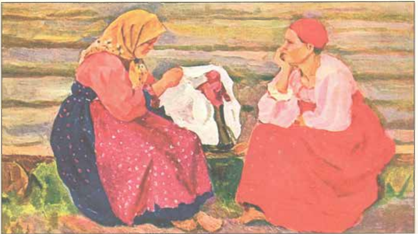
На завалинке. Женщины. 1913 г.