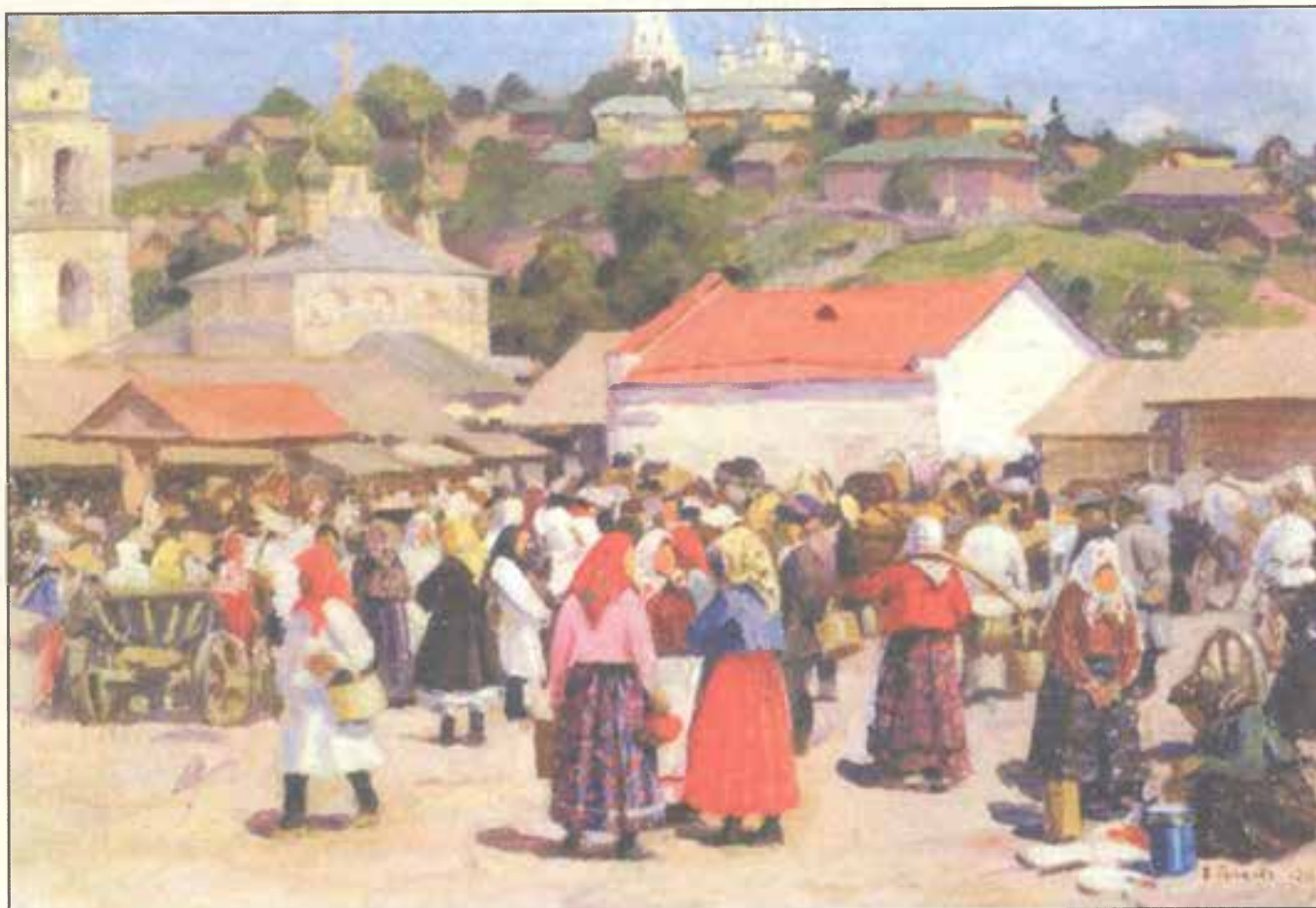
В базарный день. 1915 г. У пристани