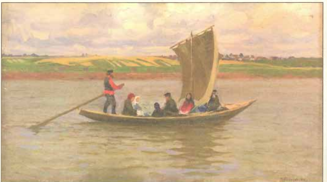
С базара. 1916 г.