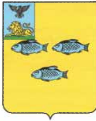
Современный герб Новооскольского округа

Но Новый Оскол хранит память о рыбе вырезуб и славных временах, когда город входил в состав Белгородской черты, защищавшей Русь от врагов. Рыба вырезуб (и даже не одна, а целых три рыбины!) сохранилась на его гербе. Вырезубов разместили там в 1780 году – ещё при императрице Екатерине Второй. Специалисты по геральдике поясняли выбор тем, что редкая уже на тот момент рыба в других реках не встречалась вовсе.