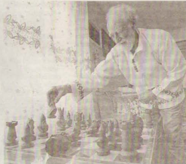
Шахматы из можжевельника вырезаны руками хозяина дома