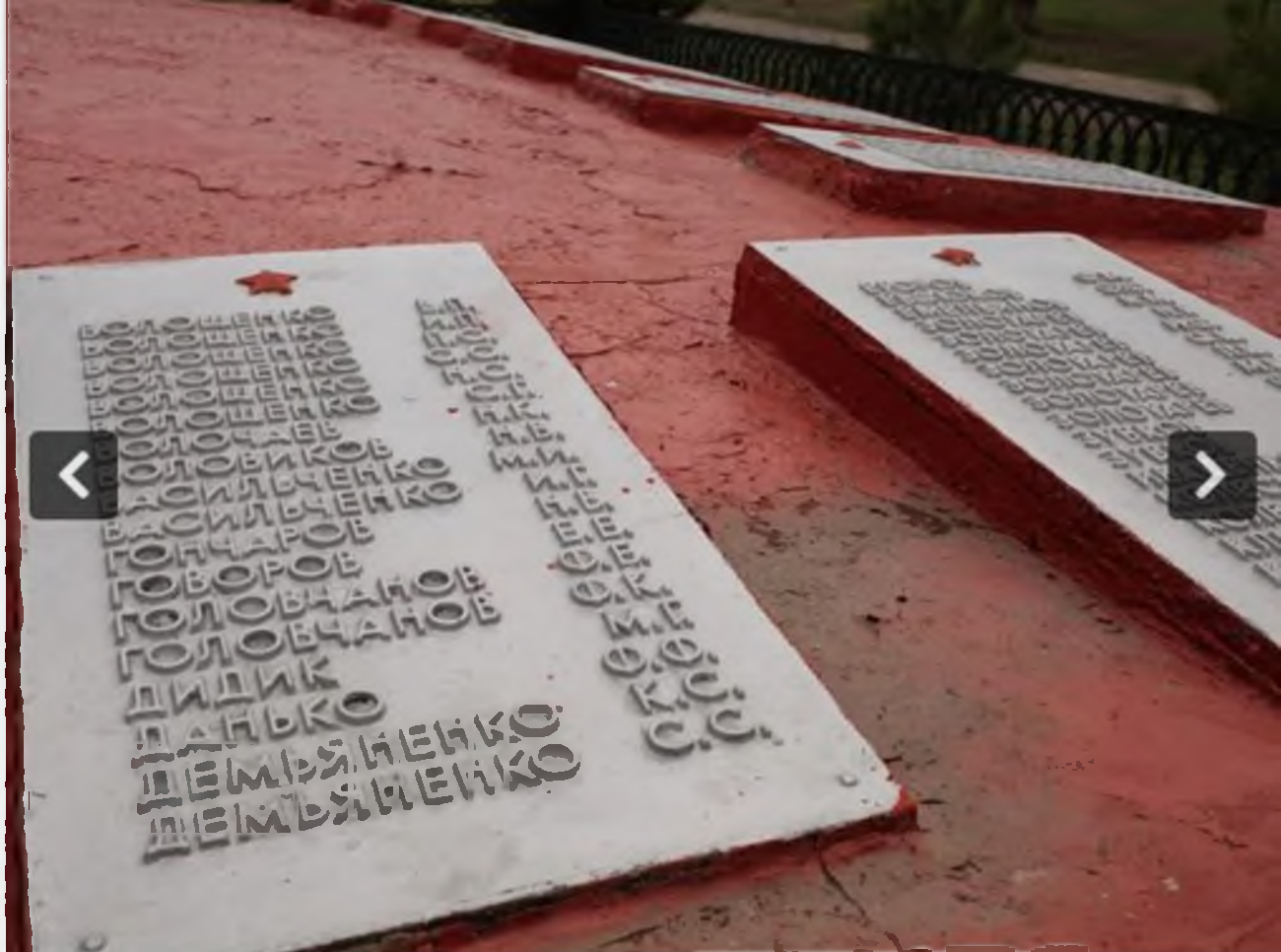
на мемориальной плите – местные фамилии