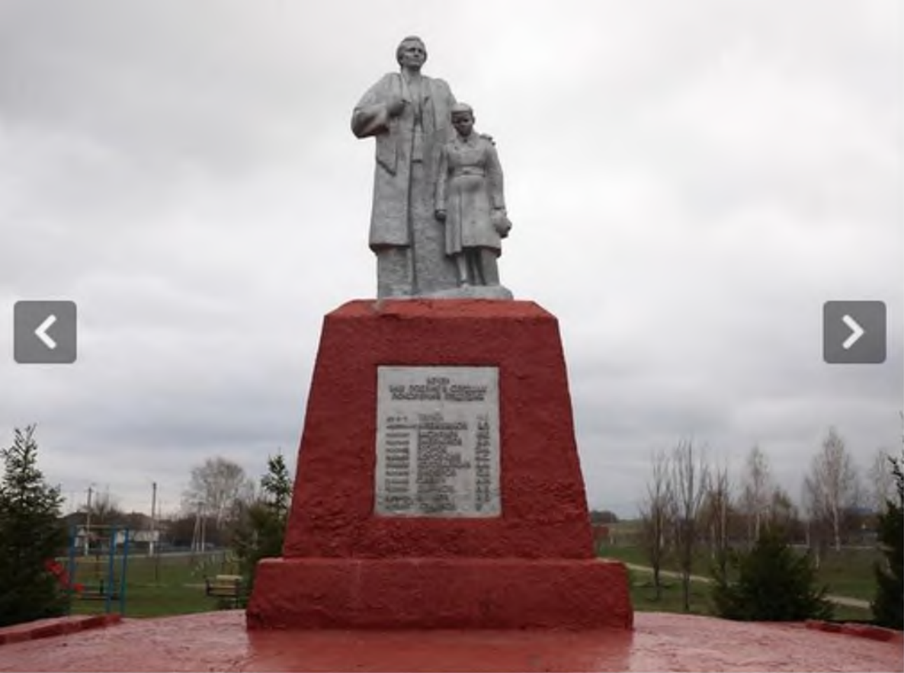
Мемориал «Скорбящая мать» в парке Победы