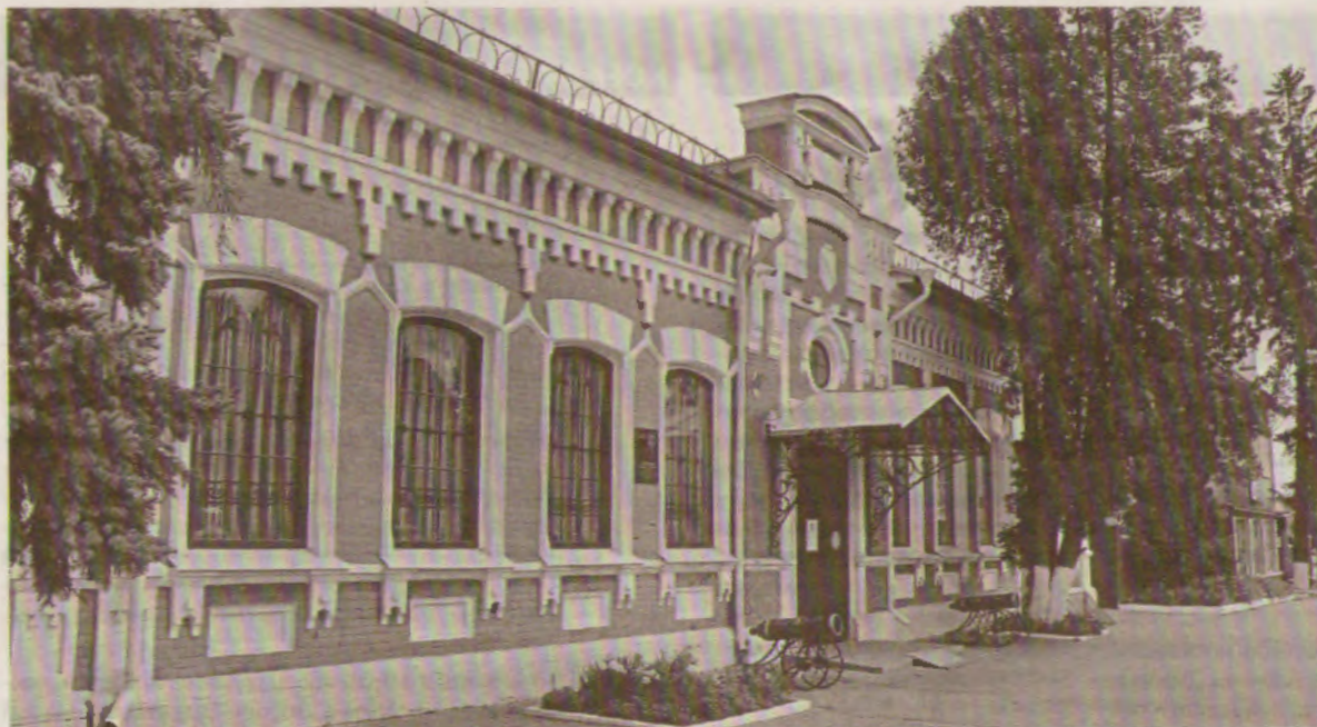
Нынешнее здание историко-краеведческого музея