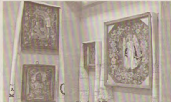
Иконопись была распространённым ремеслом в Борисовке