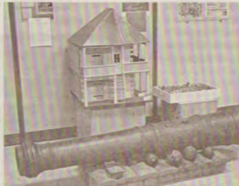
Макет домика Петра