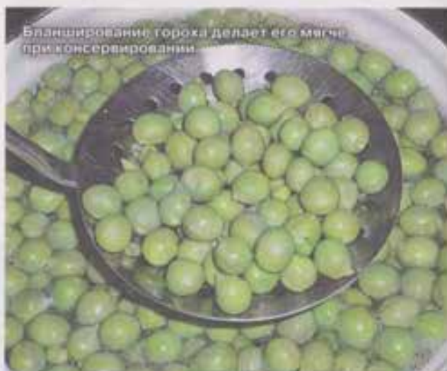
Бланширование гороха делает его мягче при консервировании.

Лидером сезона по вкусу стал Детский сахарный . Он очень ранний и урожайный, мы им лакомились уже в июне. Длинные, плотные, наполненные стручки на 6-8 горошин стали любимым лакомством, а с грядки я сняла ведро гороха. Основной минус сорта - нежные створки. При чистке они отчаянно сопротивляются, ломаются и рвутся, не давая раскрыть стручок. Приходится их по частям отковыривать. Производитель утверждает, что этот горох можно есть и со