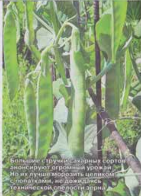
Большие стручки сахарных сортов анонсируют огромный урожай. Но их лучше морозить целиком с лопатками, не дожидаясь технической спелости зерна.

Хорошо хоть не горчит. Горошины в стручке зеленые и упругие, не повреждаются при сборе. Этот урожай я пустила на заморозку, чтобы осенью и зимой добавлять в овощные рагу. В общем, несмотря на эффектный внешний вид, вряд ли я еще буду сеять этот сорт.