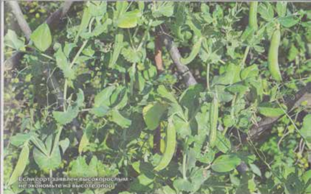
Если сорт заявлен высокорослым - не экономьте на высоте опор!

створками, но вкус при этом на любителя. Сорт рано начал плодоносить и... быстро завершил этот процесс: перезрел уже в июле. Что можно сказать? Горох хороший, продуктивный, неприхотливый и вкусный. Но слишком нежные створки не вызывают желания выращивать его снова.