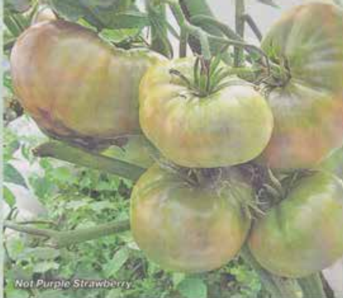
NoF Purple Strawberry

Очень наглядным получился опыт с томатом NoF Purple Strawberry . Этот среднеспелый индет дает плоды массой 150-300 г. Я выращивала его и в теплице, и в открытом грунте. В теплице сажала по два в лунку, каждый вела в два ствола. Урожайность отличная, к 21 августа томаты практически полностью созрели. В открытом грунте сажала порознь и вела в два ствола. Урожайность средняя, плоды достаточно крупные, но к 12 августа