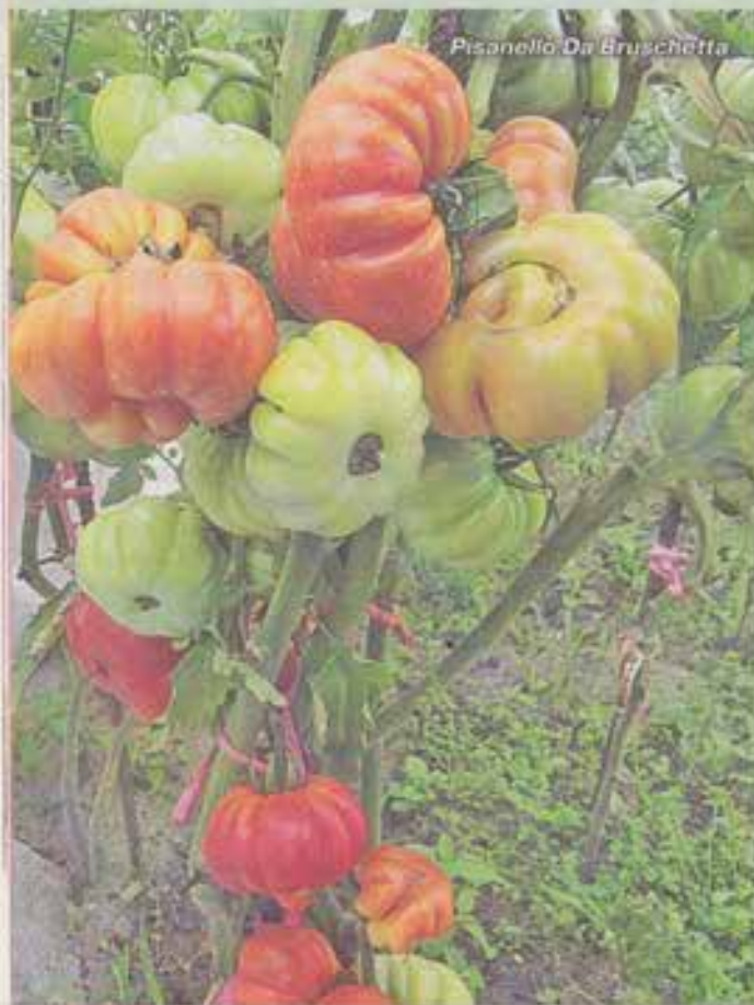
Pisanello Da Bruschetta

Томаты отличаются не только характерными сортовыми чертами, но и типом роста. И он во многом определяет, как именно нужно работать с конкретным сортом.