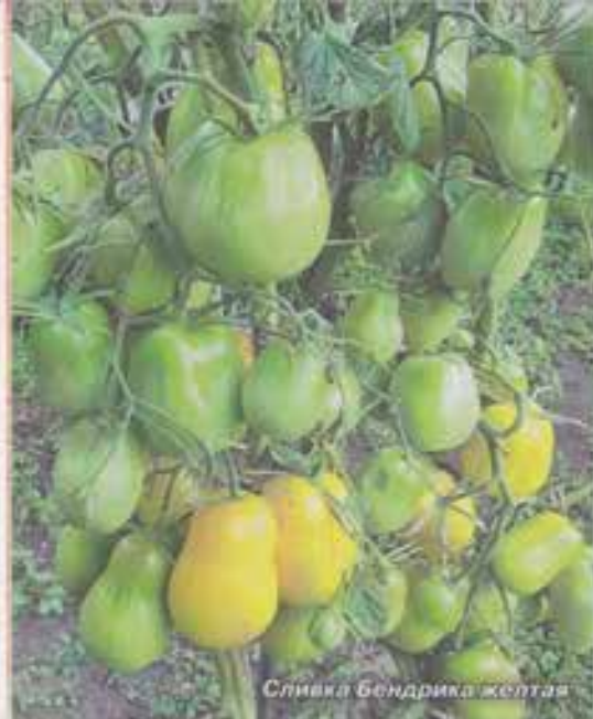
Сливка Бендрика желтая