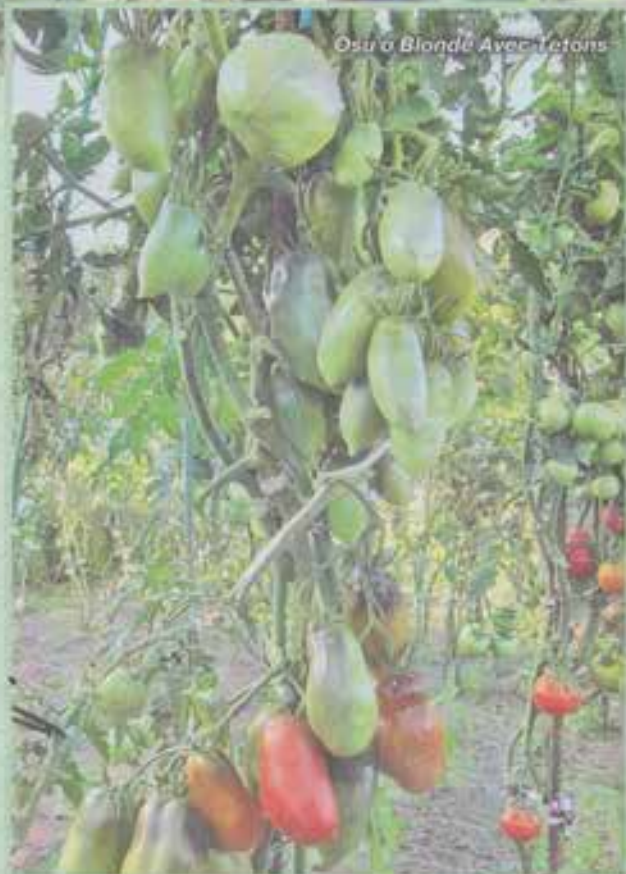
Osa's Blonde Avec Taton

Теперь перейдем к томатам индетерминантным. Общеизвестные правила их формирования - оставлять только главный побег и удалять все боковые пасынки, едва они достигнут длины 3-4 см. Но практика показала: к формированию высокорослых сортов тоже надо подходить диффе-