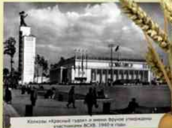
Колхозы «Красный гудок» и имени Фрунзе участвовали в конкурсе ВСХВ. 1940 г. год.

КОЛХОЗЫ «ПРИМЕРНО» И «НОВЫЙ ПО «КРАСНЫЙ ГУДОК» ПОЛУЧИЛИ НАИБОЛ ВЫСОКИЕ В РАЙОНЕ УРОЖАЙ ПШЕНИЦЫ ПО 19-19,5 ЦЕНТНЕРА С ГЕКТАРА. 1940 г.