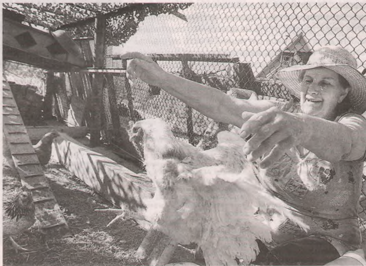
По закону кур на даче разводить нельзя. Но люди держат, когда соседи не против...

Впрочем, в другом деле Верховный суд услышал доводы жителя Тюменской обл., который содержал на своём участке для садоводства и огородничества корову, телёнка, свиней и кур. Получив штраф от главного госинспектора, садовод-животновод обратился в районный суд, но проиграл его. Однако ВС РФ отменил это решение и направил дело на повторное рассмотрение, которое пока продолжается.