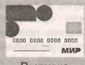
Выписка счёта карты «МИР» либо сберегательный счёт