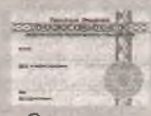
Страховое свидетельство обязательного пенсионного страхования