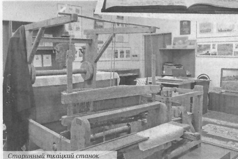
Старинный ткацкий станок