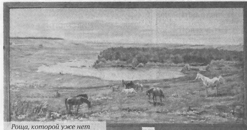
Роща, которой уже нет