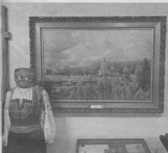
Сельский пейзаж Исаака Бродского

Откуда в Шебекинском историко-краеведческом музее появились картины знаменитых художников