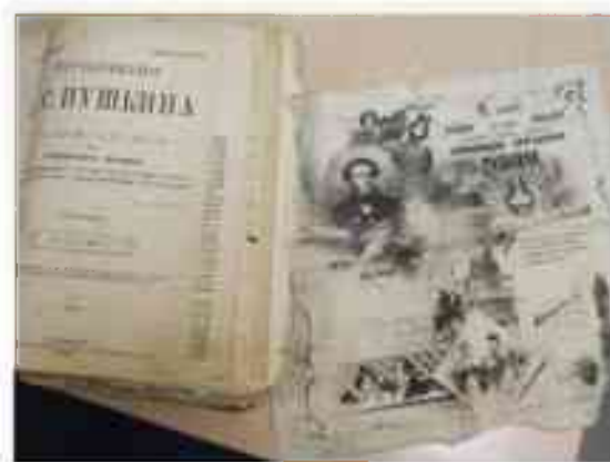
8 фактов о Пушкинской библиотеке-музее