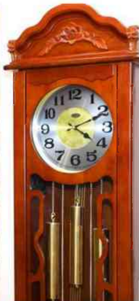
Пушкинская библиотека-музей