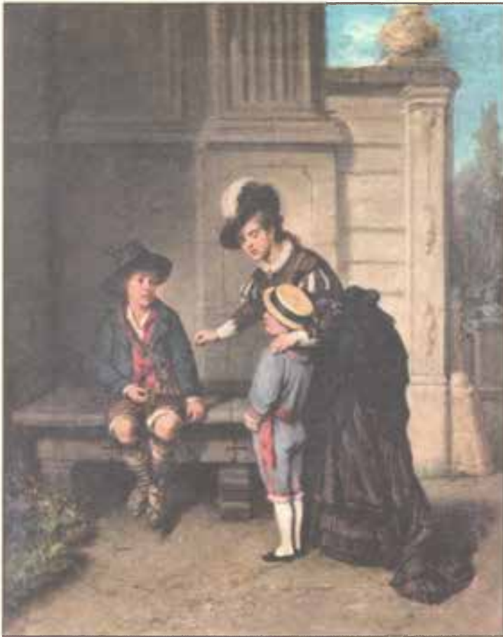
Благотворительность. 1878 г.