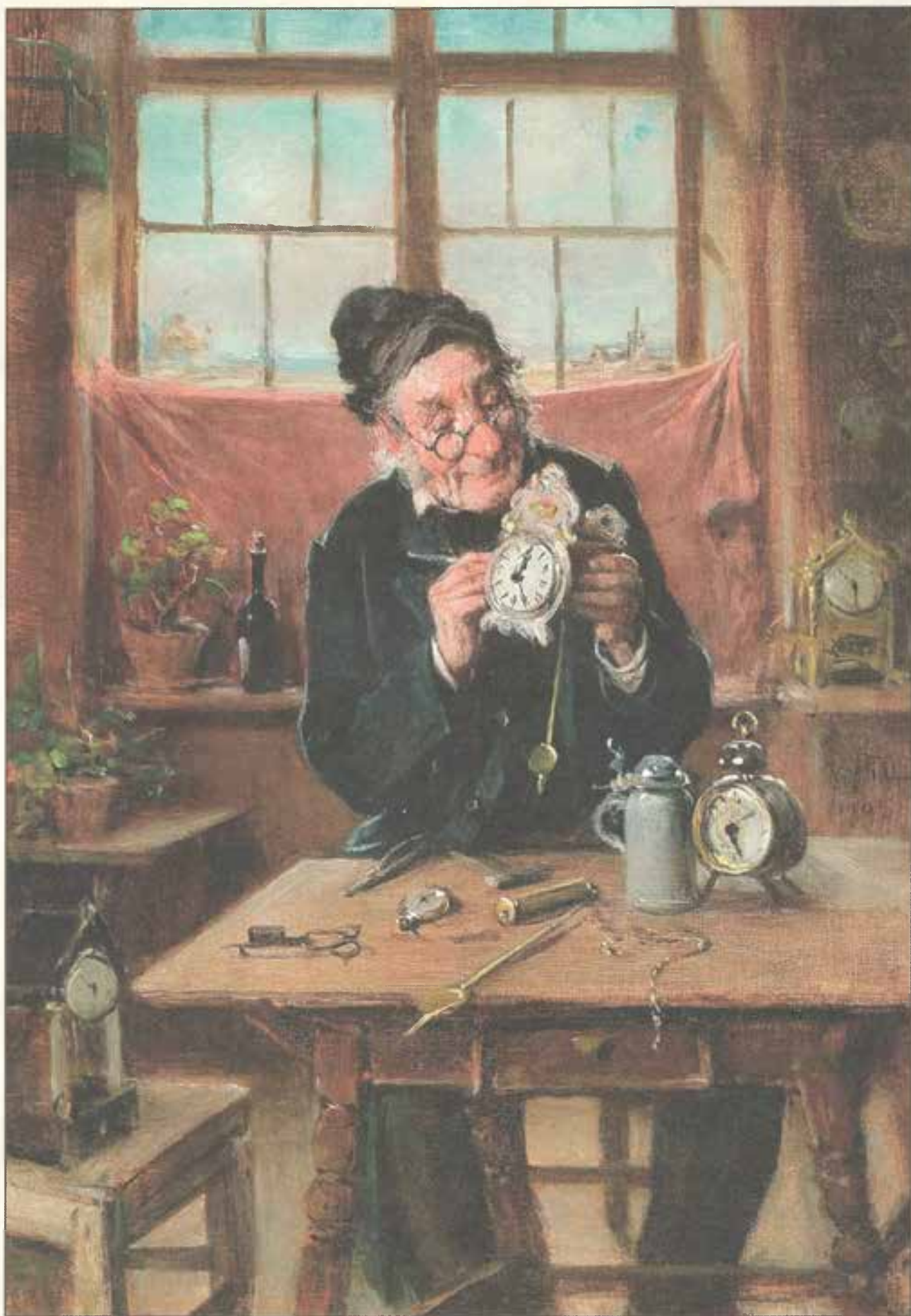
Часовщик. 1881 г.