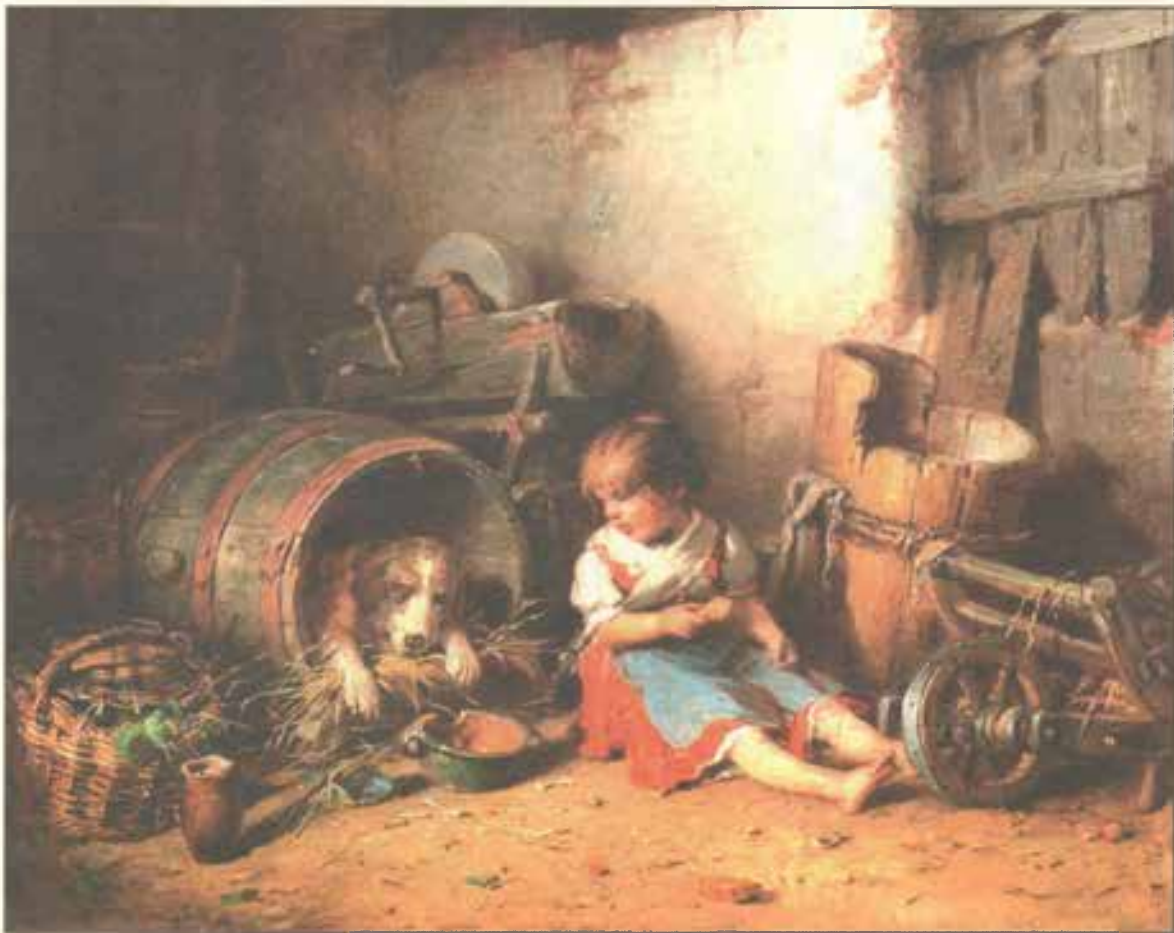
Друзья. 1875 г.