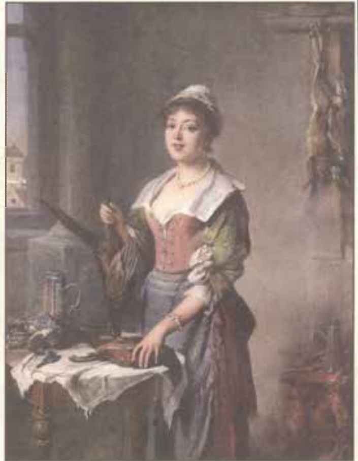
Битые фазаны. 1901 г.