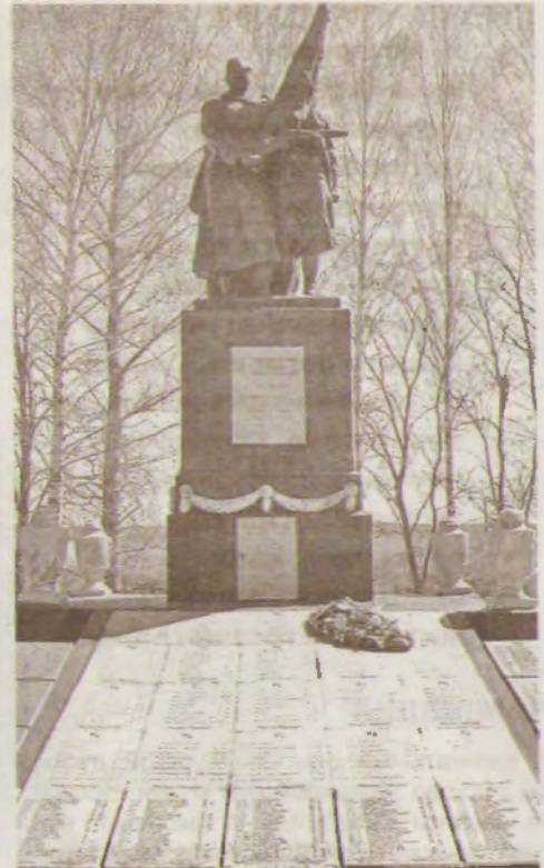
Братская могила в селе Никольское.