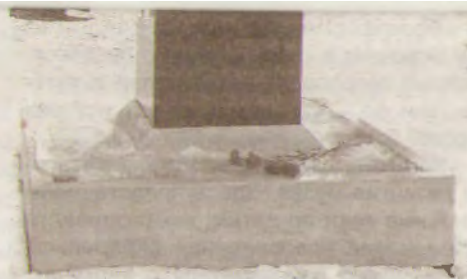
Памятный знак на позиции снайпера.