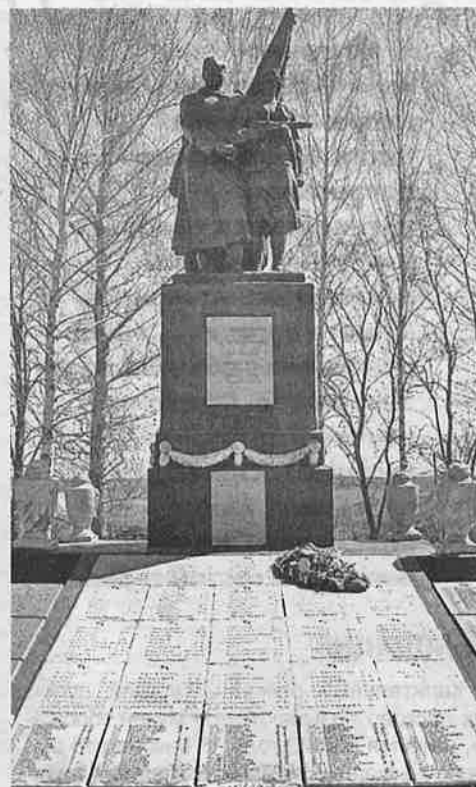
Братская могила в селе Никольское.