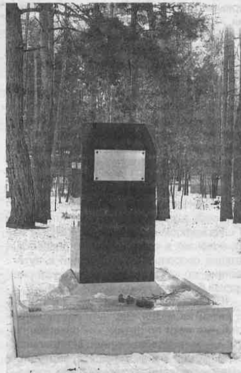
Памятный знак на позиции снайпера.