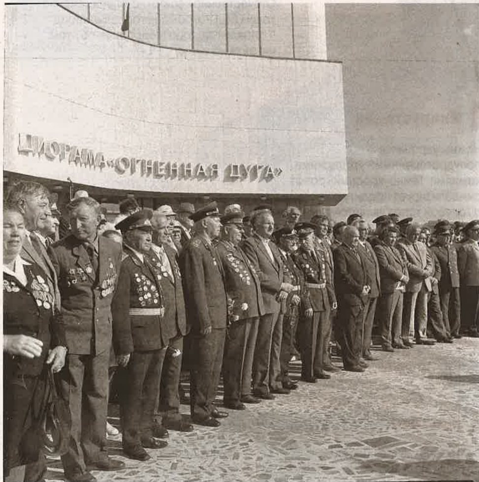
Ветераны Великой Отечественной войны на открытии музея-диорамы.