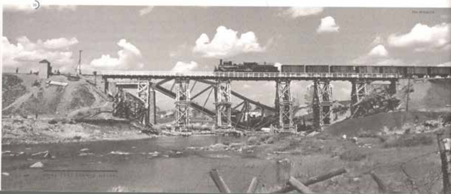
* 16 Мост, восстановленный военными железнодорожниками за восемь суток. Калининский фронт. 1943 год.