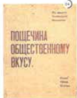
*4, 5 «Пощечина общественному вкусу» — знаменитый манифест футуристов.

Оно станет не только самым знаменитым стихотворением поэта — всего русского футуризма. С него и начнется слава поэта.