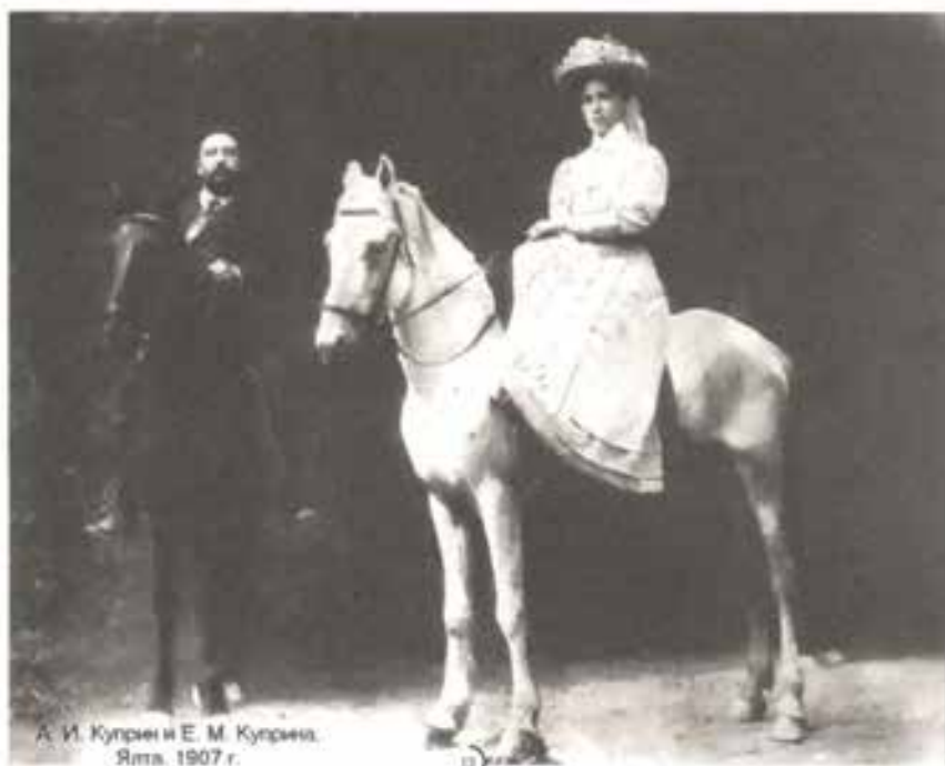
А. И. Куприн и Е. М. Куприна. Ялта. 1907 г.

Когда в 1917-м после долгого перерыва зазвонили колокола, Куприн удивился — это из-