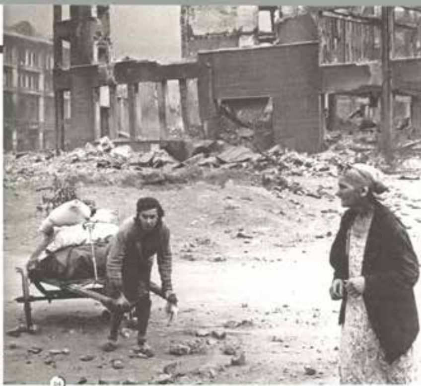
СПОР О ДАТЕ

Зенитная артиллерия Сталинграда ее нейтрализовать не могла, а советские истребите-