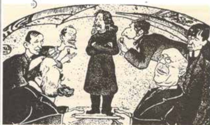
Чествование К. Бальмонта в «Бродячей собаке», 1913. Карикатура М. Шафрана