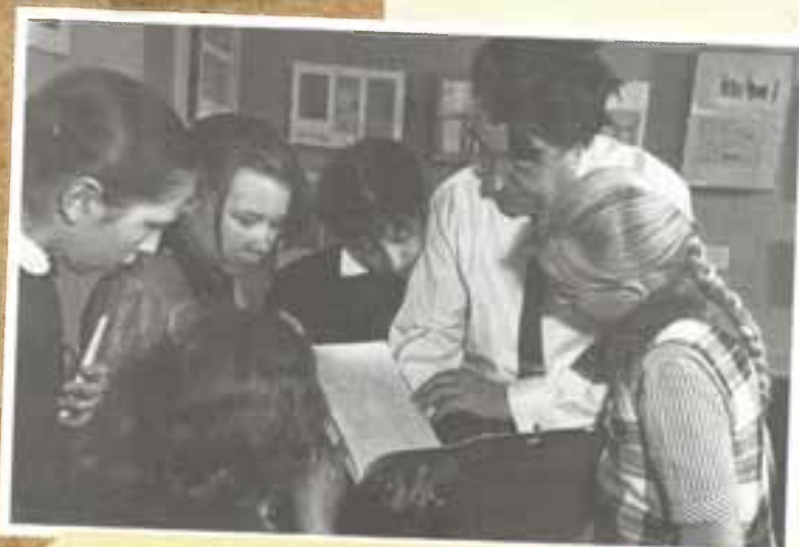
Борис Полевой со школьниками. 1960-е годы

Обязательно прочтите книгу или посмотрите фильм о легендарном лётчике. Это рассказ о силе духа, любви к Родине и ненависти к врагу. О настоящем русском характере.