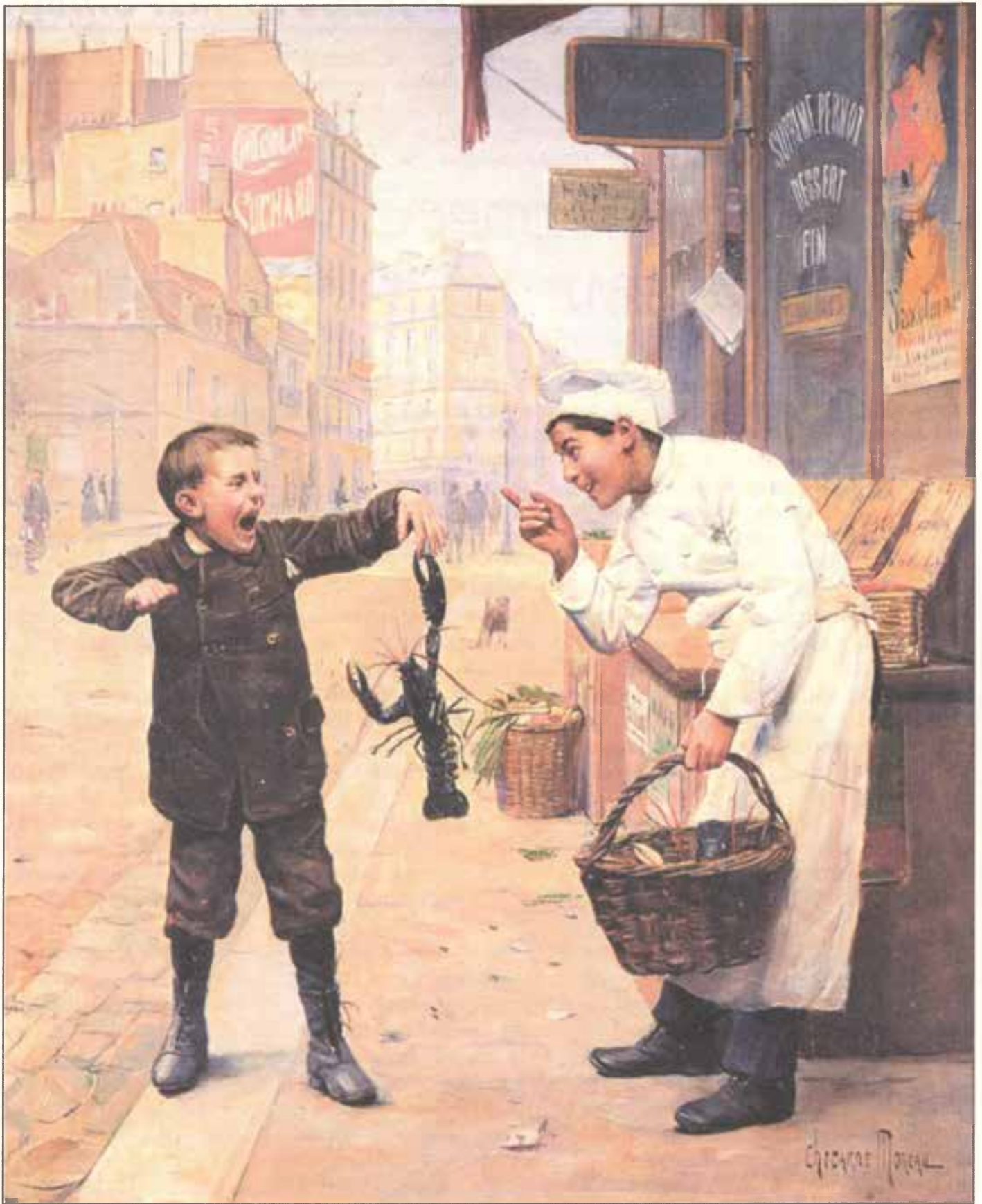
Я же тебе говорил