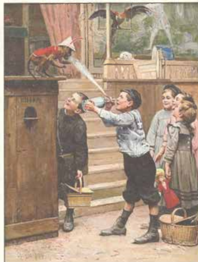
Сюрприз для обезьянки