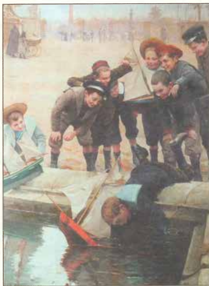
Сад Тюильри. Игры у водоёма