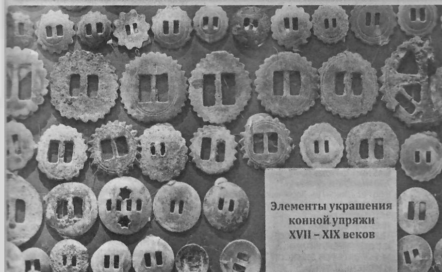
Элементы украшения конной упряжи XVII – XIX веков