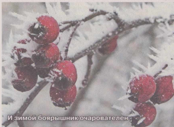
И зимой боярышник очарователен

Итак, познакомимся с крупноплодными видами боярышника, которые все чаще и чаще появляются в российских садах. Это боярышник полумягкий и Арнольда (виды завезены из Северной Америки) и боярышник перистонадрезанный (дальневосточный вид).